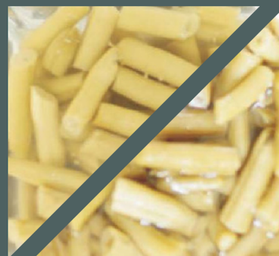
Dosenbohnen 150 rpm, 1,9 m 3 /h