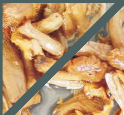
Dosenpilze 300 rpm, 3,9 m 3 /h

Durch die medienschonende Arbeitsweise können wir noch eine Vielzahl an weiteren Produkten fördern.